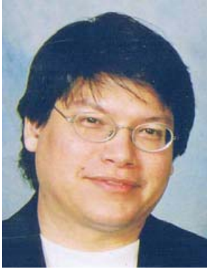
En el año 2000