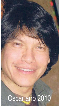
Oscar año 2010

Programa de Formación Certificado por el Instituto Demartini.