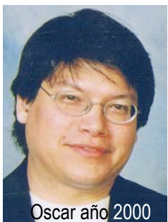
Oscar año 2000